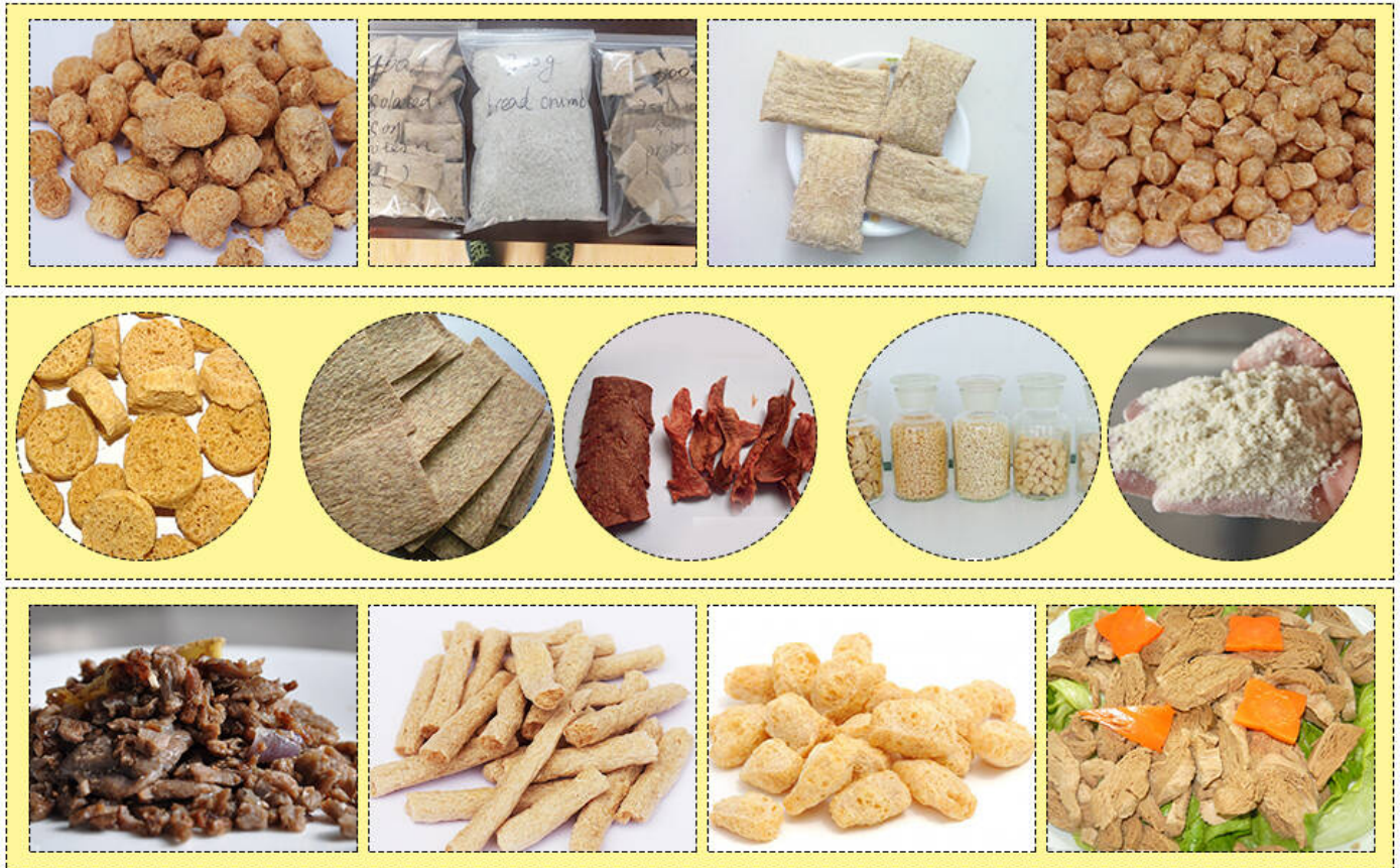
Foto de detalle de la máquina de la línea de producción de proteínas de soja

Extrusora de doble husillo - la máquina principal para la producción de proteínas de soja. Se utiliza para exprimir y inflar materiales y luego formar diferentes formas. De acuerdo con las diferentes tasas de diseño del tornillo para satisfacer diferentes requisitos tecnológicos.