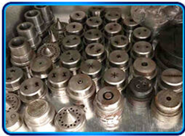
IMAGEN DETALLADA DEL EQUIPO PRINCIPAL DE LA MÁQUINA EXTRUSORA DE TORNILLO DOBLE